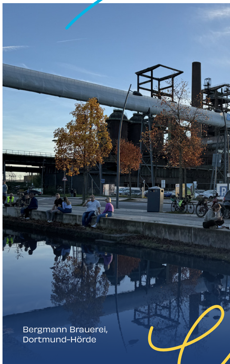
Bergmann Brauerei, Dortmund-Hörde