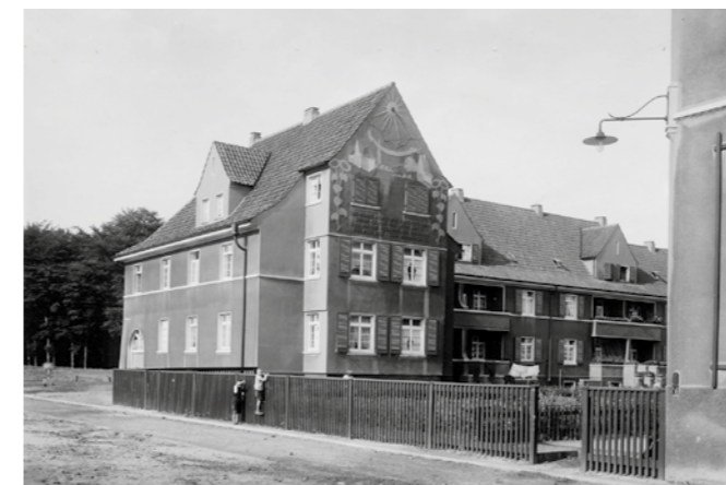
Inmitten von Flur und Feld errichte die damalige Dortmunder Gemeinnützige Siedlungsgesellschaft 1926/27 das Quartier „Zur Sonnenseite“ mit der Kemminghauser Straße.