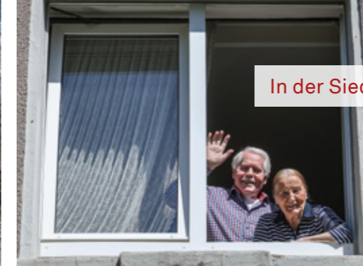
In der Siedlung „Zur Sonnenseite“ in Eving