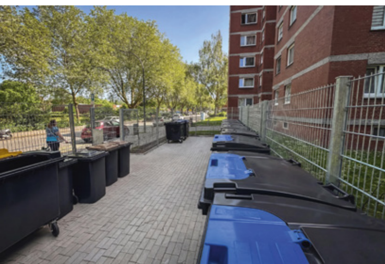
Aufgeräumt und übersichtlich: Neu gestaltete Standplätze für Abfallbehälter an der Gefölerstraße 10 in Wambel.

Gut bewertet werden von den Mieter*innen im Bereich Wohnung und Wohngebäude vor allem die Erreichbarkeit von Klingelanlagen und Briefkästen, die Beleuchtung von Treppenhäusern und Eingangsbereichen sowie die Funktion der Heizungsanlagen. Auch der Zustand vieler Gebäudebereiche findet breite Zustimmung.