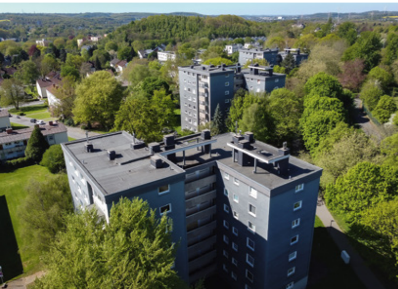
Weniger Energieverbrauch und weniger CO 2 -Ausstoß: DOGEWO21 macht die Punkthäuser klimafit.

DOGEWO21 modernisiert drei Punkthäuser in Brünninghausen und setzt dabei auf klimafreundliche Technik und mehr Wohnkomfort.