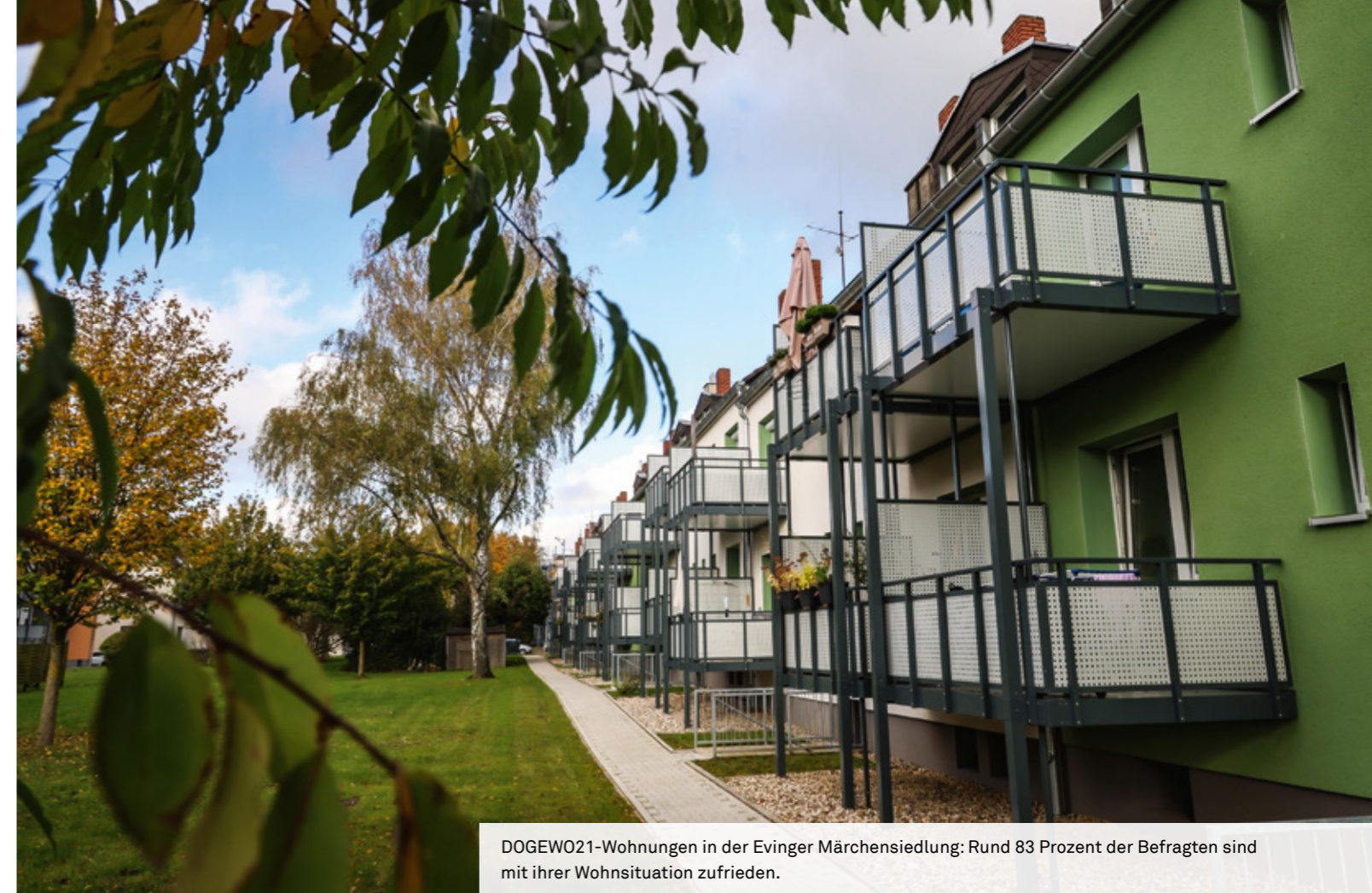
DOGEWO21-Wohnungen in der Evinger Märchensiedlung: Rund 83 Prozent der Befragten sind mit ihrer Wohnsituation zufrieden.

Darüber hinaus plant DOGEWO21 Pilotprojekte für hochwertige Fahrradgaragen in ausgewählten Quartieren. Sie sollen sichere Abstellmöglichkeiten für E-Bikes, Fahrräder und E-Scooter schaffen und gleichzeitig die nachhaltige Mobilität stärken.