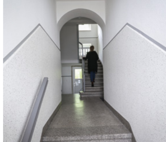
Hausflur in der Planetenfeldstraße nach der Modernisierung...

Auch die Treppenhäuser in der Von-der-Tann-Straße und der Davidisstraße wurden neu gestaltet. Im Kaiserblock hat DOGEWO21 die Bereiche bis zur oberen Etage gefliest und die oberen Stockwerke mit robuster Beflockung versehen. Zusätzlich wurden im Bereich Präsidentenstraße die Mülltonnenstellplätze in die Innenhöfe verlegt. All diese Maßnahmen sind Teil eines umfassenden Programms von DOGEWO21 zur Modernisierung und Verschönerung von Treppenhäusern und Hauseingängen.