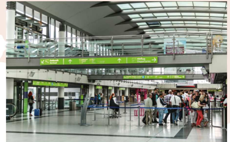
100 Jahre Dortmund Airport: Wo hat die Geschichte des Flughafens begonnen?

2. Der Phoenix-See mit seiner Promenade ist zu einem der beliebtesten Ausflugsziele Dortmunds geworden. Darüber hinaus übernimmt er eine weitere wichtige Funktion für Dortmund. Welche?