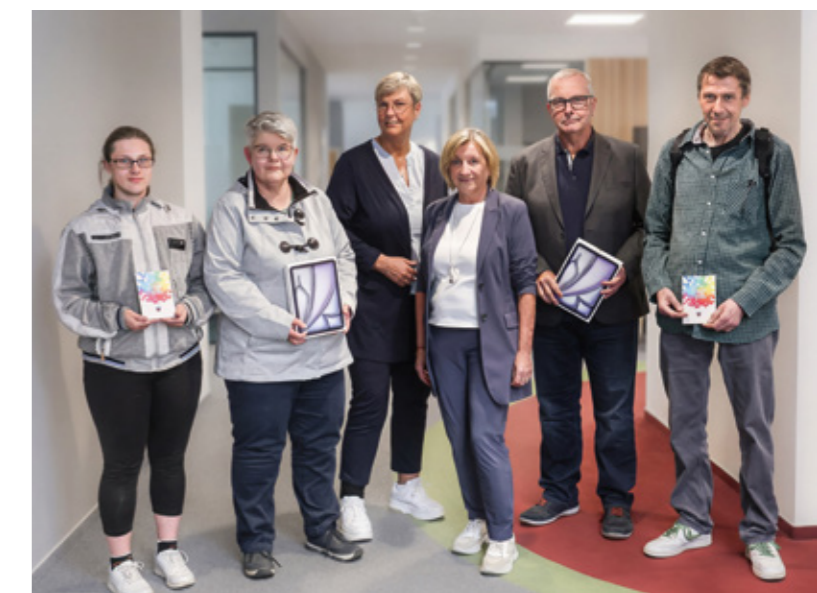
Als Dankeschön für die rege Beteiligung an der Umfrage hat DOGEWO21 unter den Teilnehmer*innen iPads und Einkaufsgutscheine im Wert von je 50 Euro verlost.

aber kein Grund, sich entspannt zurückzulehnen. Im Gegenteil: „Wir verstehen die Hinweise und Wünsche unserer Mieter*innen als Auftrag, unsere Quartiere weiterzuentwickeln, den Service zu stärken und das Wohnen Schritt für Schritt noch besser zu machen“, so der Sprecher der Geschäftsführung.